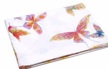
LENZUOLO SOPRA MATRIMONIALE FONDO BIANCO cm 240 x 280, PERCALLE.