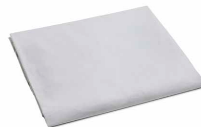
LENZUOLO SOTTO SINGOLO FONDO GRIGIO cm 90 x 200 + angoli cm 25, PERCALLE.