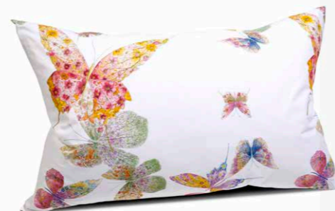
FEDERA A SACCO FONDO BIANCO cm 50 x 80, PERCALLE.