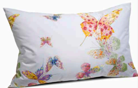
FEDERA A SACCO FONDO GRIGIO cm 50x80, PERCALLE.