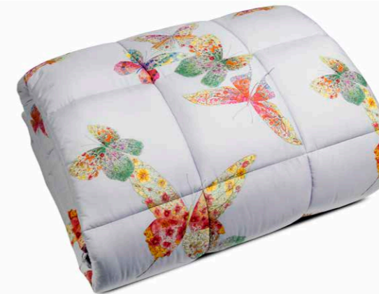
TRAPUNTA SINGOLA FONDO GRIGIO cm 170 x 265 COTONE