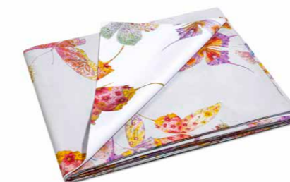
SACCO COPRIPIUMINO SINGOLO DOUBLE cm 155 x 200 + patella di cm 40, PERCALLE.