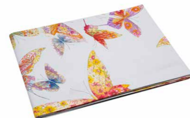
LENZUOLO SOPRA SINGOLO FONDO GRIGIO cm 160 x 280, PERCALLE.